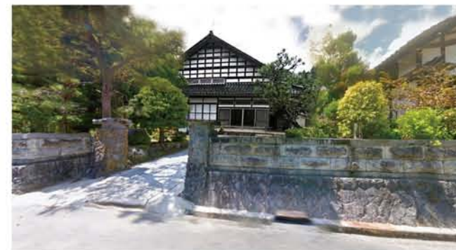
山森会長の生家（古民家）を改装し、西の杜学園や関連団体と連携した地域創生の新たな拠点として整備する計画も進行中

財団は、少子高齢社会と過疎化が進む中で、氷見市の伝統や文化、自然環境を背景に、新たな地域共同体の構築を図り、関連諸団体や専門家とともに事業活動を通じて雇用の創出、関係人口の増加と交流で氷見の地域活性化を推進します。