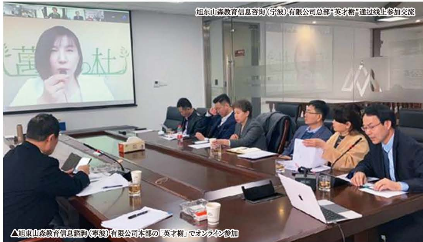
旭東山森教育信息咨询(寧波)有限公司本部「英才樹」通过线上参加交流