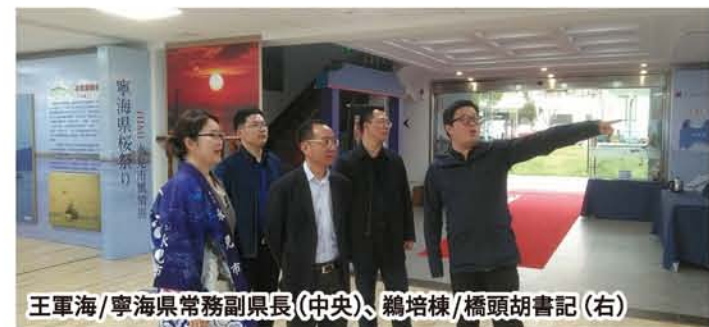
王軍海/寧海県常務副県長(中央)、鶴培棟/橋頭胡書記(右)

会場では、氷見を紹介するパネルや物産などが展示されたほか、公園の池には立山連峰の巨大なディスプレイも設置されました。公園内では、店舗数が前回の倍以上に増えた日中美食屋台でも半被(ハッピー)を着て氷見をPR。桜まつり期間中の開催でしたが、来場者は1万人近くに上りました。