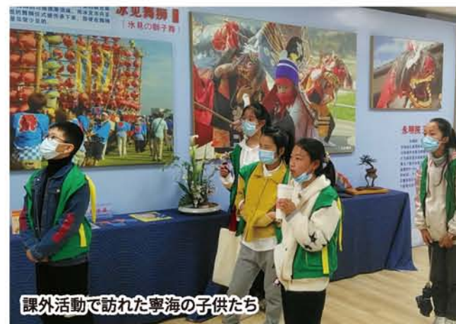
課外活動で訪れた寧海の子供たち

展会上除了有介绍氷見的图片、土特产外、还在公園の池塘中设立了巨大的立山連峰展示板。日中美食摊位的店铺数量相比上届几乎翻倍、很多摊主身着氷見特色节日上衣、为氷見做了大力的宣传。