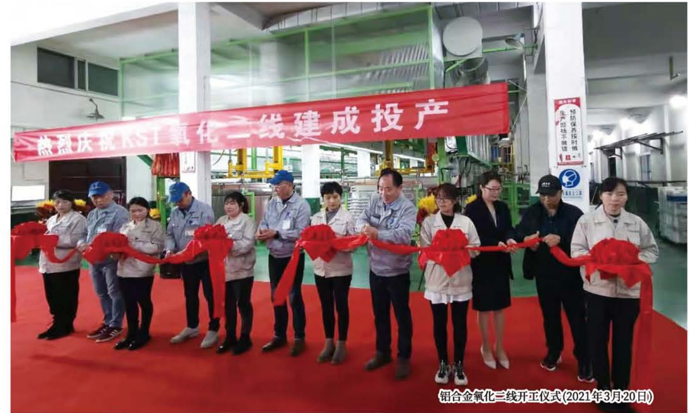
铝合金氧化二線開工儀式(2021年3月20日)