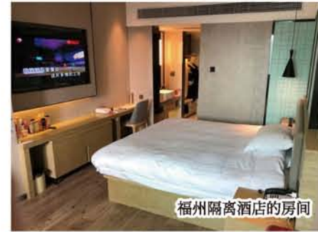
福州のホテルの部屋

孫: 房间没有打扫。当然, 床单、被套、毛巾的更换统统没有。洗衣服用的洗涤剂、肥皂、洗发水、纸巾、垃圾袋等都会给准备两周的用量, 每天下午3点和傍晚7点, 把垃圾放到房间的门外, 就会有人来回收, 倒没有觉得不方便。