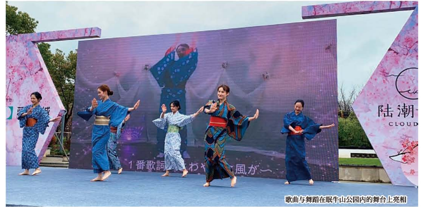
歌曲与舞蹈在眠牛山公園內的舞台上亮相