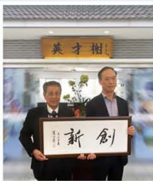
【表紙説明】 2018年に眠牛山公園内にあるKYEC本部「英才樹」を訪れた褚銀良 寧波市副市長(右)と山森会長(左)

2018年寧波副市長褚銀良(右)視察KYEC本部英才樹(眠牛山公園内)、山森会長(左)