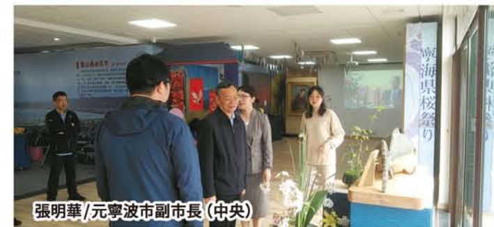
張明華/元寧波市副市長(中央)